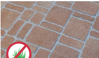
Auch mit Unkrautschutz!