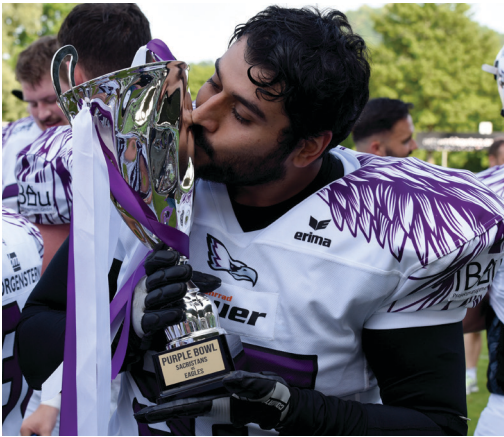
Gibt es das Sie-gerküsschen für den Pokal dieses Jahr von den Sacristans?

Freiburg und Reutlingen verbindet nicht nur die Regionalliga Südwest, sondern auch eine zentrale Sache: Die Teamfarbe Lila – auf Englisch „Purple“.