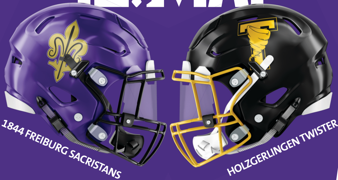
1844 FREIBURG SACRISTANS